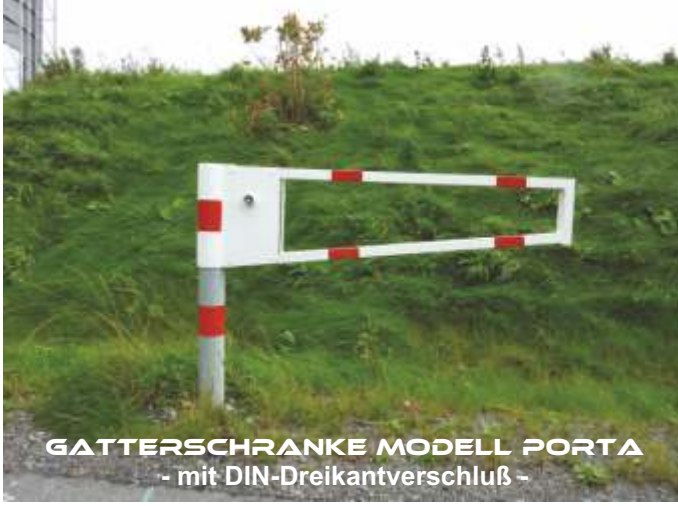
GATTERSCHRANKE MODELL PORTA - mit DIN-Dreikantverschluß -