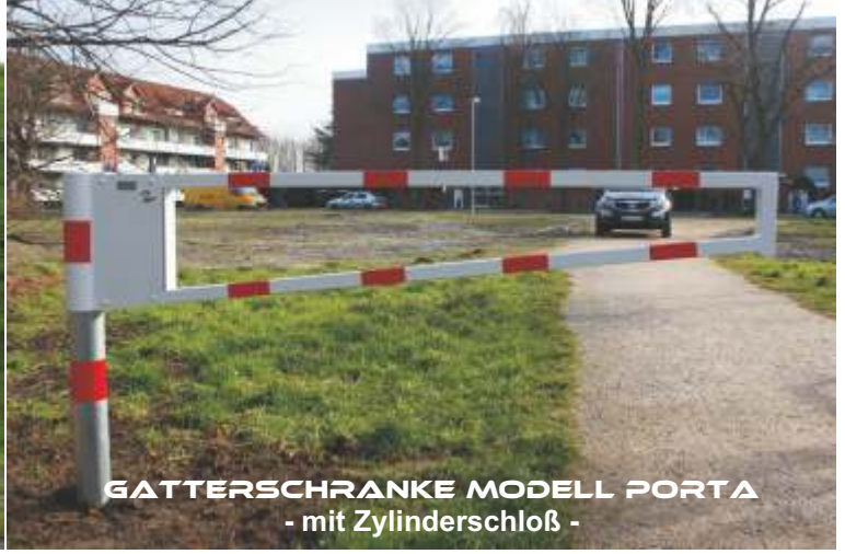
GATTERSCHRANKE MODELL PORTA - mit Zylinderschloß -

Die robuste, drehbare Gatterschranke empfiehlt sich immer dort, wo eine häufige Öffnung gewährleistet werden soll und auf langlebige Ausführung geachtet werden muß.