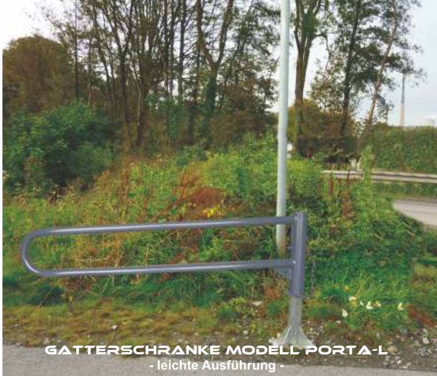
GATTERSCHRANKE MODELL PORTA-L - leichte Ausführung -

Die leichte, drehbare Gatterschranke besteht aus einem Standrohr mit \varnothing 89 mm und einer Gesamtlänge von 1500 mm.