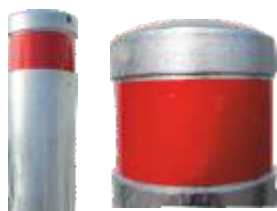
KOPENHAGEN - F -