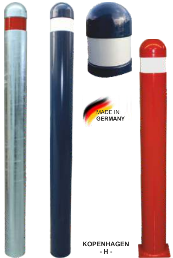
KOPENHAGEN - H -