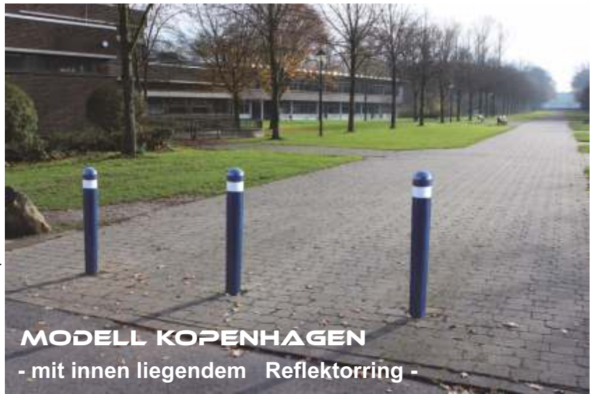
MODELL KOPENHAGEN - mit innen liegendem Reflektorring -

Stilpoller aus feuerverzinktem Rundrohr, Ø108 mm, mit innen liegendem Reflektorring, 60 mm hoch, Kopfabschluß als Halbkugel wie Modell Düsseldorf Strasse, gewölbter Scheibe wie Modell Kleppingstrasse oder Flachkopf. Die Poller werden zum Einbetonieren, zum Aufdübeln mit Fußplatte oder herausnehmbar aus Bodenhülse 80x80 mm gefertigt. Die herausnehmbaren Poller sind kompatibel zu unseren Pfosten für 80x80 mm Bodenhülse. Die eingelassenen Reflexfolien können in den Farben: rot, gelb, grün, weiß und schwarz bestellt werden. ( Bitte bei Bestellung angeben )