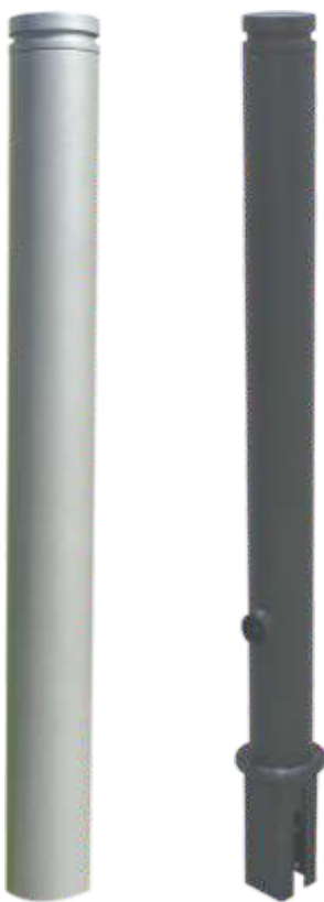
9.751Z mit RAL-Beschichtung