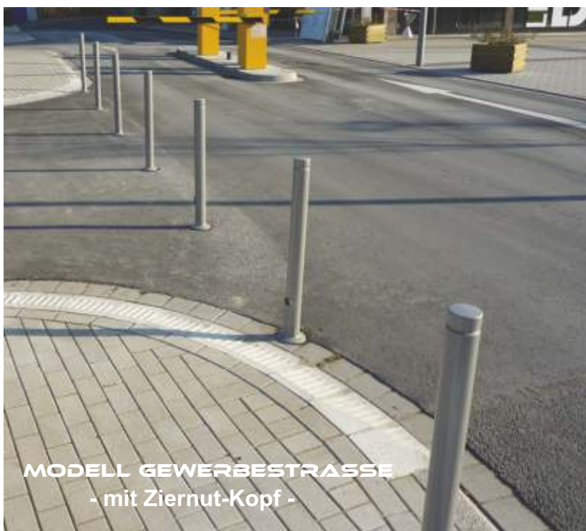
MODELL GEWERBESTRASSE - mit Ziernut-Kopf -