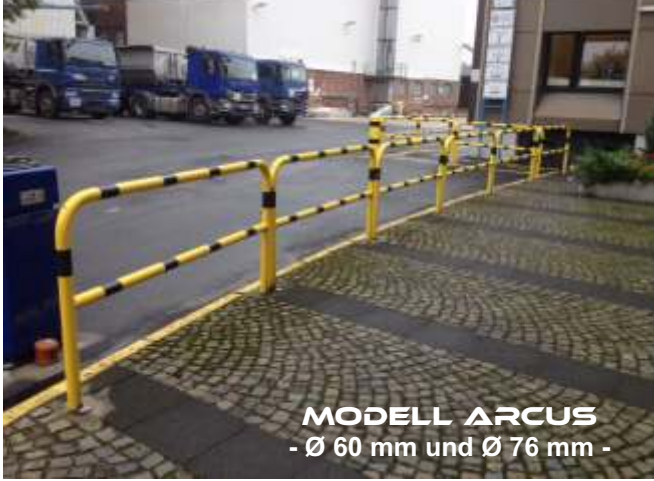
MODELL ARCUS - Ø 60 mm und Ø 76 mm -