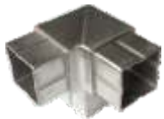
43056 90° Eckverbinder