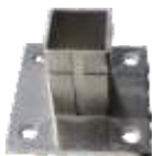
43090 Fußplatte 85x85x6 mm Lochung 4 x 11 mm