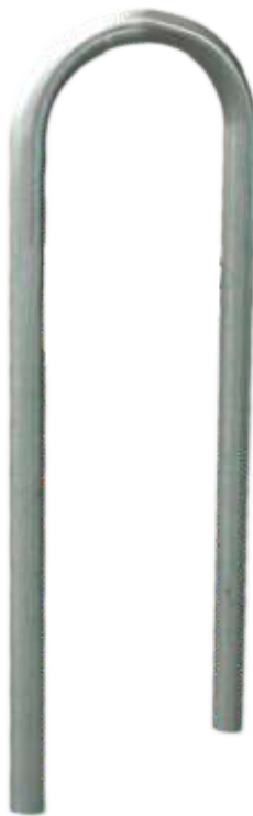
Beispiel Ø 60 x 380 mm