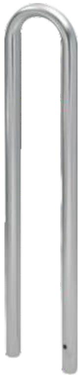
Beispiel Ø 48 x 300 mm