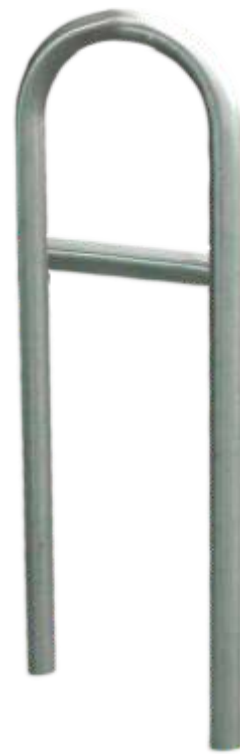
Beispiel Ø 60 x 380 mm mit Querholm

U - Bügel aus Edelstahl, Korn 240 geschliffen, in den Rohrdurchmessern 48 mm und 60 mm, wahlweise mit oder ohne zusätzlichen Querträger.