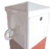
Beispiel Aufpreis Spitzkopf Bitte bei Bestellung angeben